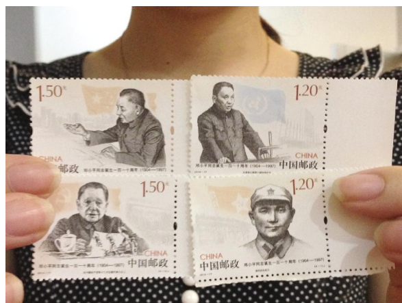
8月22日,《邓小平同志诞生一百一十周年》纪念邮票发行,吸引了众多集邮爱好者前来温州市集邮专卖店购买。据悉,这是继1998年发行《邓小平同志逝世一周年》(6枚)、2004年发行《邓小平同志诞生100周年》(2枚邮票+1枚小型张)之后,我国发行的第三套伟人邓小平纪念邮票。