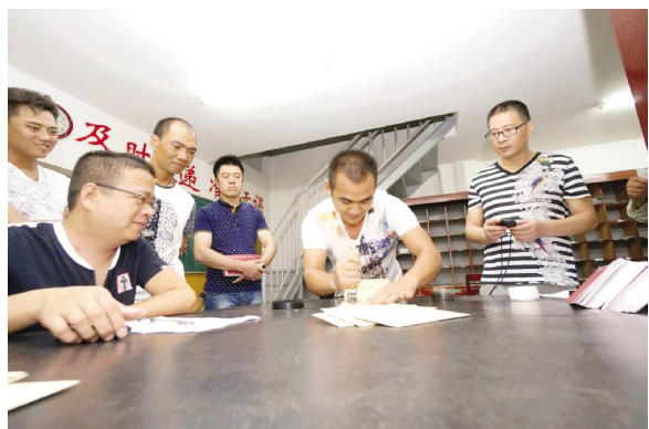
8月9日,来自永嘉全县13个支局的30多名投递员选手参加了该局举办的投递员技能竞赛活动。竞赛分理论竞赛和实践操作两部分,其中理论竞赛题取自邮政投递员高级技能考试题库,实践操作设数报套报、排信、批条处理、加盖日戳四个项目。