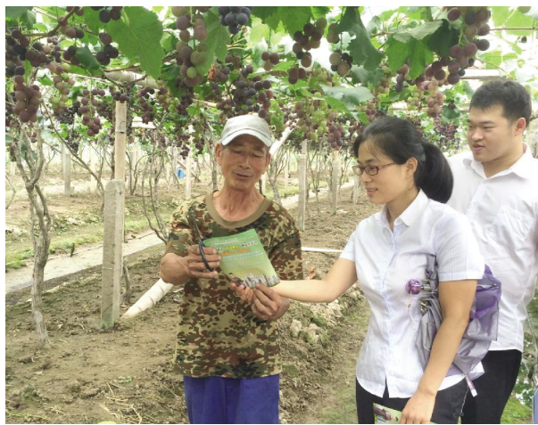
近日,苍南马站营业所员工赶在苍南蒲城的葡萄上市前,头顶烈日下田间,逐一到葡萄种植户进行走访摸底,及时了解种植户今年的收成情况,宣传邮政存款邮礼活动,并对意向客户信息进行登记,以便后续跟进。

会议指出,下半年工作要从应对、学习、提升、冲刺四方面着手,以温州市分公司各类考核指标及本局六项重点工作为基础,破发展瓶颈,决战三季度,冲刺四季度。一是落实交流学习,借鉴“他山之石”破解难题。一方面要走出去多看多学,引进优秀项目;另一方面要深入基层调研,践行督导工作机制,领导班子要对接各经营单位,共同研究问题,解决对策。二是提升服务质量、能力,融入基层群众,研究出好产品,提供差异化服务;同时要做到提升分享,实现正确沟通、相互信任、团队协作。三是正视上半年差距,将精力集中到生产经营上,以“凤凰涅槃”的精神化解各种难题,一步一步追赶差距,确保完成全年收入目标。