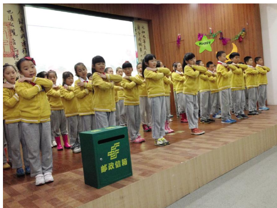
5月12日,温州市分公司集邮公司联合市鹿城区慈善总会,在市墨池小学举办“弘扬孝道文化 献给母亲的爱”为主题的集邮文化进校园活动。活动中小学生们带着母亲上台朗诵书信表达对母亲的爱,并将给母亲的话写在孝道文化邮资封上,投入邮政信箱之中,寄送一份孝心。(陈纬 摄影报道)

在具体运作上,该局以“三级网格”为依托,即局领导、市场部牵头,虚拟团队与各支局对接组成统筹性网格;支局长负责组成支局网格;各支局综合营销员、投递员根据邮路、业务市场等划分为若干基础网格。该局计划在今年完成“三步走”战略,一是各基础网格开展数据采集、维护录入,规范基层营销的台帐建设,整合完善函件数据库资源。二是集中运用数据资源,在下半年的报刊大收订和两包市场开放中运用,实践,全力开发私费市场。三是总结验收阶段,从实践中总结经验,以信息化为引领,更好地实现区域营销一体、小包承揽一体。