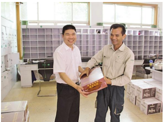
泰顺局高温慰问一线员工