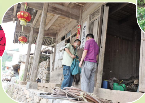
6、表叔家来信了。兰速文,还没到门口,就兴高采烈地喊了起来。