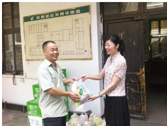
瑞安局高温慰问一线员工

7月份,瑞安、乐清、苍南、永嘉、泰顺、瓯海、邮运等局领导纷纷深入基层慰问一线员工,送去了一丝清凉和一份关爱。