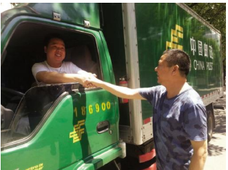
邮运局高温慰问邮路驾驶员