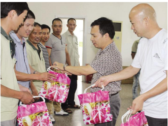
瓯海区局开展夏令慰问