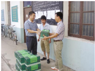
乐清局慰问外勤工作人员