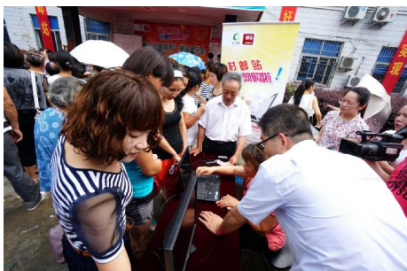
工作人员现场演示操作村邮网购

据了解,为更好地服务“三农”,让更多的村民真正享受到家门口的一站式服务,除岩头镇广化社区和桥下镇昆阳社区已经开通网购平台外,预计到7月底,永嘉局还将开通沙头镇中堡村、大岩镇水云村、岩坦镇溪口社区、巽宅镇界坑社区四个服务点。