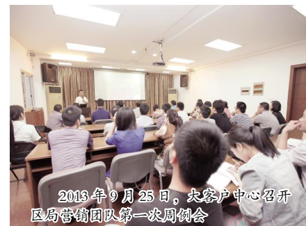
2013年9月25日,大客户中心召开区局营销团队第一次周例会

目前,该局四大区局已经初步组建了共50余人的营销团队,大客户中心正借助理财经理的培育方式,开周会、培训、交流、实行业绩PK、通报、奖励等方式,从全流程和全环节把控中提升区局的营销能力。