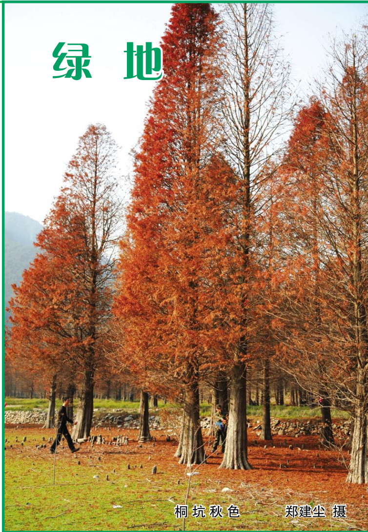
桐坑秋色