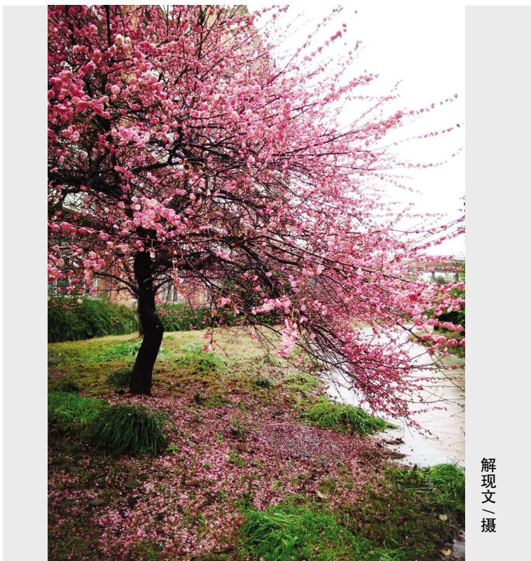
解 现 文 摄

拉开窗帘,趴在窗户上,遥望,想要把自己想看到的看到。有时,视线不觉会模糊了,有时会看到云朵晃来晃去,累了吧,累了就休息一阵。梦里,我看到所有的梦想绽放了。我们,都打开了心里那扇窗,摘下面具,彼此张望。