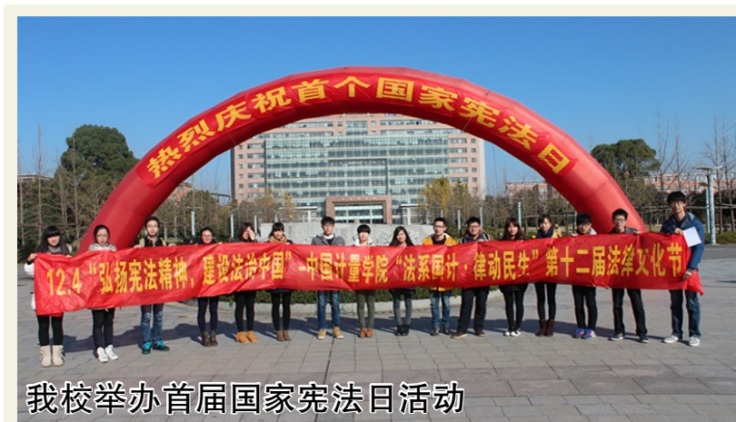
我校举办首届国家宪法日活动

本报讯 12月7日,我校选送的文明寝室情景剧《青春的信》以排名第二的成绩荣获“青春园 梦想行”2014年浙江省大学生文明寝室情景剧二等奖。(邓宇轩)