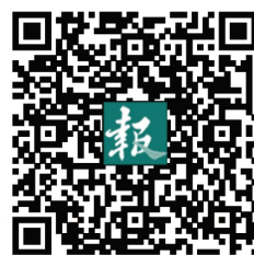
安卓客户端 校报手机报

蝴蝶的爱情故事似乎与满身带着凉意的冬季无关,但冷冬里依然存在一束束温情,我依然要把爱情与这个季节联系在一起。我想,蝴蝶折掉的翅膀不会被风带走,那温暖的爱也不会随岁月流逝,很多看似悲伤的结局其实并不像人们所想的那样哀伤,是喜或悲,只有故事中的入才能真正感受到。只要我们细细体味,就会相信,爱是一个季节永恒的点缀。