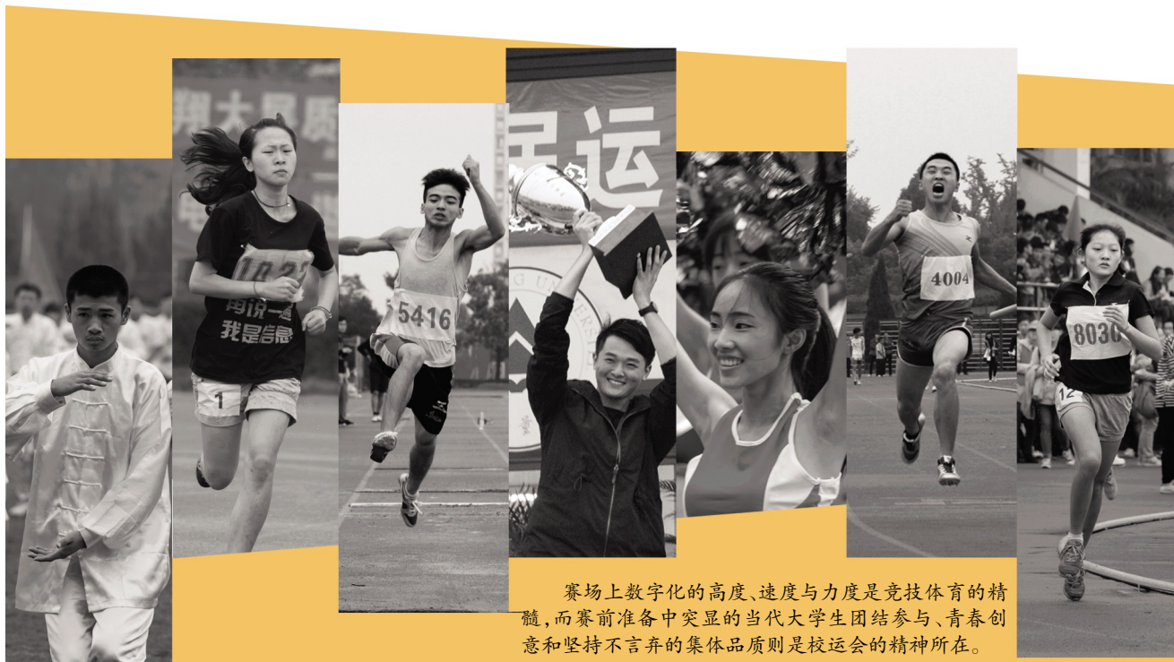
赛场上数字化的高度、速度与力度是竞技体育的精髓,而赛前准备中突显的当代大学生团结参与、青春创意和坚持不言弃的集体品质则是校运会的精神所在。