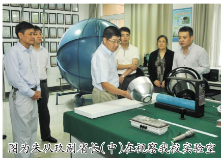
图为朱从玖副省长(中)在视察我校实验室