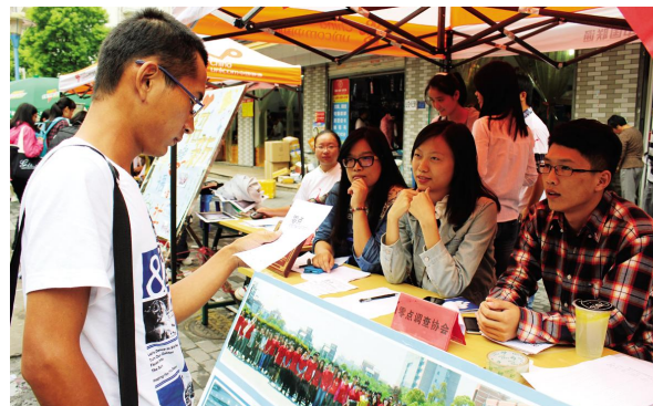
零点调查协会招新现场

“我很庆幸能与这样一个优秀的学生会主席一起共事,他是一个很棒的小伙伴。当时量新毕业生晚会要进嘉量,后来晚会道具组的人员不够,主席临危出任道具组组长,我和各位部长任组员,全程靠双手打点。晚会现场布置的气球不够,我们就把所有学生会人员集结到办公室,硬是靠嘴吹出了 3000 多个气球!”只有 300 多人的量新学院通过学生会全体人员的团结协作,愣是将毕业生晚会成功搬进了嘉量大会堂的舞台,足见团结的魔力。