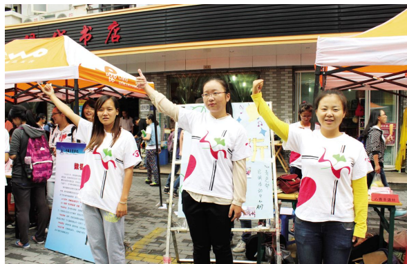
心青手语社招新现场

体育健身类社团: 轮滑社、篮球协会、相和棋社、零点球协、智趣博弈协会、E-sport 电脑达人、双截棍协会、酷派自行车协会、思威跆拳道协会、桌游协会、岚羽社。