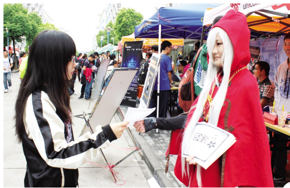
通羽动漫社招新现场