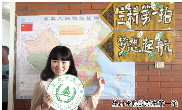
生命学院的新生第一拍

除了伪装成志愿者，许多不法分子还会直接去学生寝室推销货源，或者冒充老师让大家购买辅导材料。为此，早在放假之前，学校就和白杨派出所进行了联系，让助理班主任将编好的一本防骗案例集通过QQ群发放到每个新生的手上，提醒大家注意防骗。