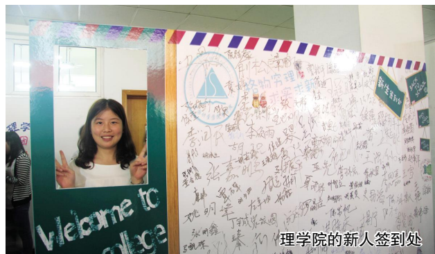
理学院的新人签到处