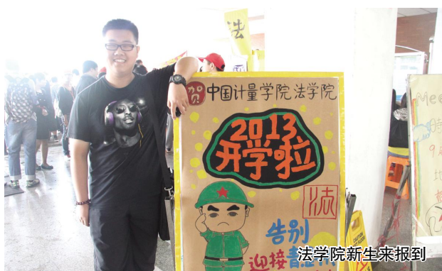
法学院新生来报到