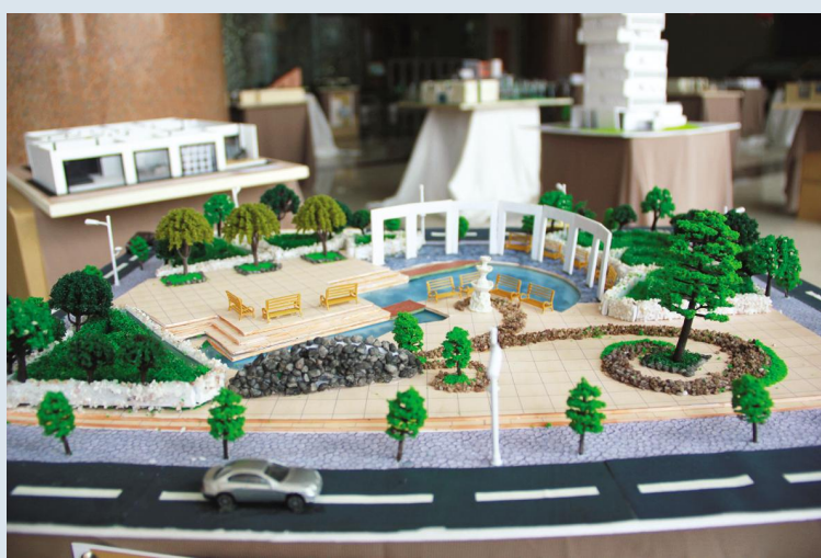
5月4日-8日,艺术与传播学院2011级环境艺术设计系模型设计作品展在逸夫图书馆举行。同学们的新鲜创意和精心制作吸引了不少往来的目光。图为作品《木矩水苑》。(余子洋)

“希望教职工‘健身月’活动能和‘师生新年环校跑’、‘东西区学生篮球争霸赛’一起成为我校体育健身活动的三大品牌。”校长林建忠说。他号召全体教职员工积极投入体育健身活动中,共同延长生命的长度,增加生命的厚度。