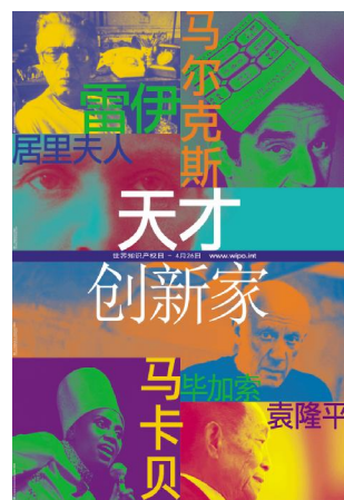
图为2012世界知识产权日海报

在加入世界知识产权组织的近30年来,中国在知识产权领域取得了骄人成绩。其中,中国去年通过《专利合作条约》(PCT)途径提交的国际专利申请量位居全球第4位;中国国内申请人通过马德里商标国际注册体系提交的商标注册申请量位居全球第7位;中国部分城市的版权产业相关产值已超过城市GDP产值的10%。