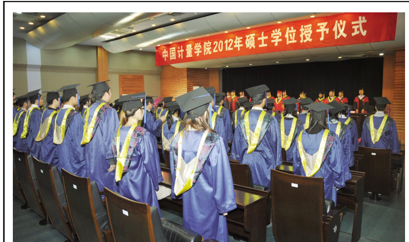
3月13日,我校举行了2012年(春季)硕士学位授予仪式,共有147名研究生获硕士学位。(本报记者/文 王玮/摄)

通知要求全校上下要充分认真开展“我们的价值观”大讨论活动的重要意义,将其作为凝聚人心,弘扬优良校风、教风和学风的有效抓手;活动要全面发动、广泛参与,要注重创新、务求实效。学校希望通过此次活动,进一步提炼学校精神,形成师生普遍认同、共同遵循的道德规范和行为准则,为学校科学发展提供强大精神动力和深厚思想文化根基。