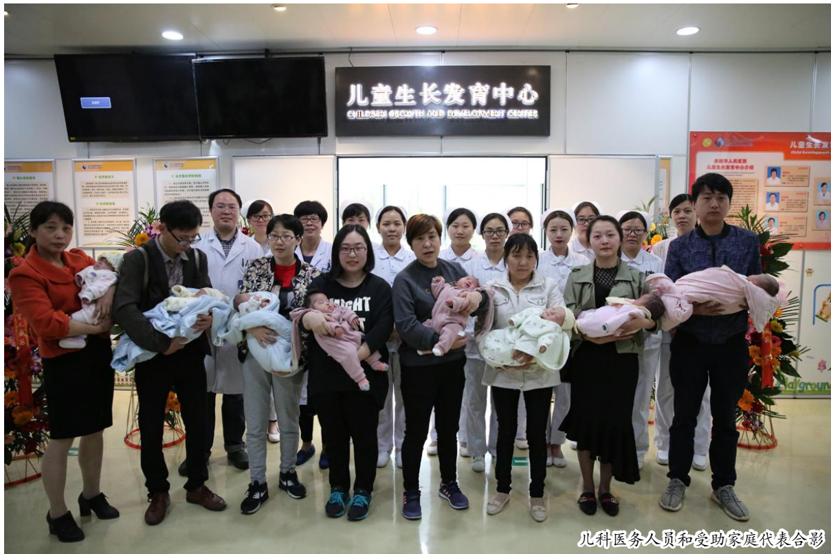
儿科医务人员和受助家庭代表合影